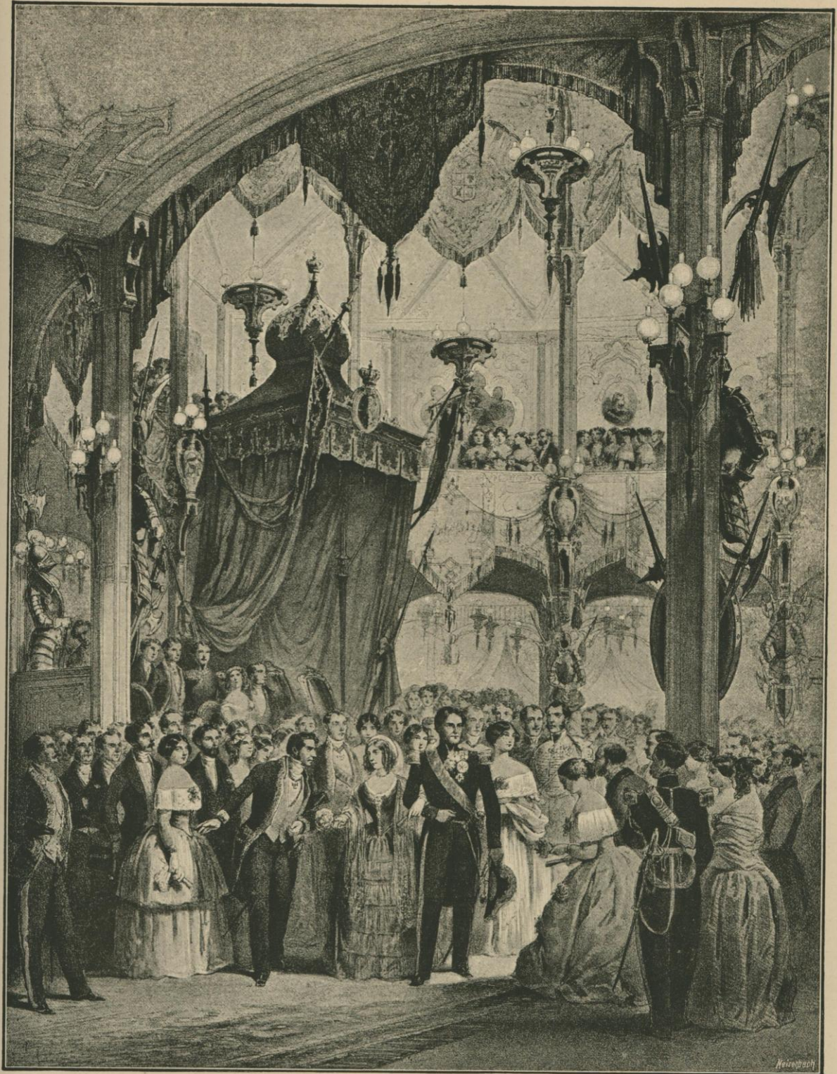
RÉCEPTION DU ROI ET DE LA REINE AU BAL D'INAUGURATION DU MARCHÉ DE LA MADELEINE, LE 26 SEPTEMBRE 1848.

Fac-simile de la lithographie de Huard et Stroobant. — Communiquée par M. Molenschot.